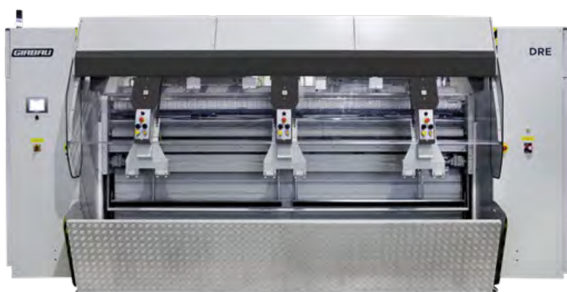
Modo de artículos grandes

El DRE es el introduccion Girbau más versátil, más productivo y de más alta velocidad que jamás haya existido. Su flexibilidad admite la introducción de una amplia variedad de artículos en la planchadora y, a su vez, proporciona resultados de calidad superior en menos tiempo.