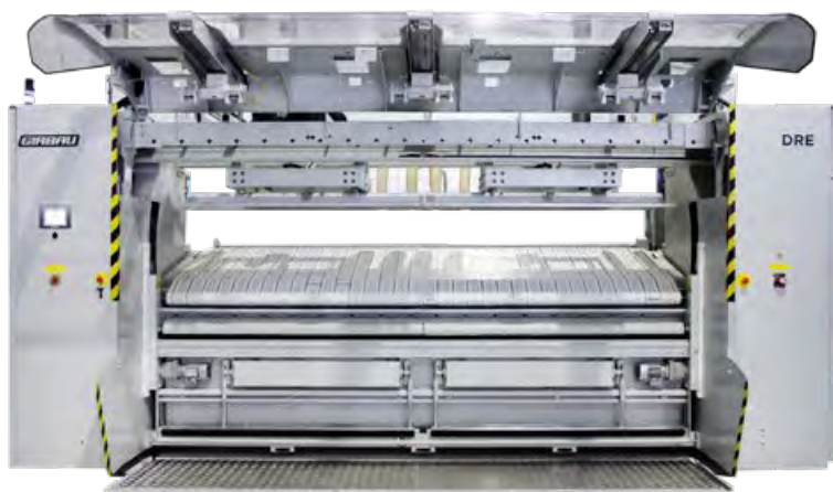
Modo de artículos pequeños