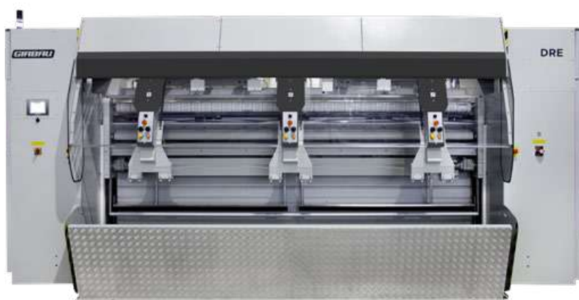
Mode grands articles

La DRE est l'engageuse Girbau la plus polyvalente, la plus productive et la plus rapide jamais produite. Très flexible, elle permet d'engager une large gamme d'articles dans la repasseuse tout en garantissant des résultats de haute qualité en un temps record.