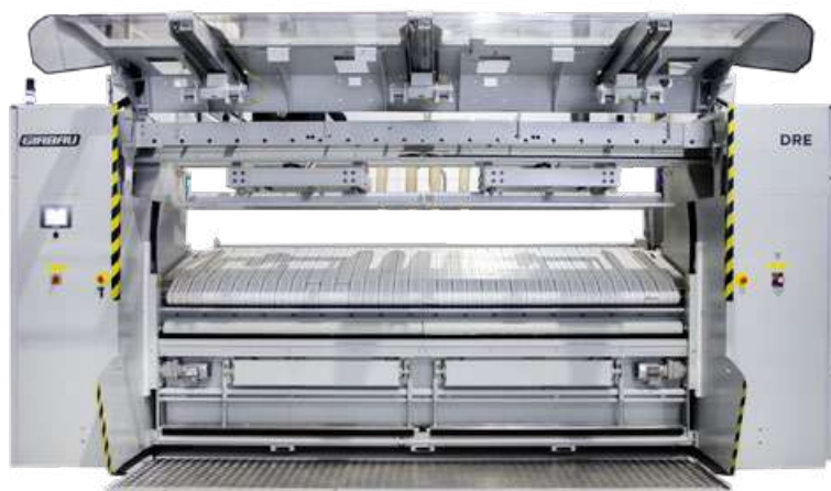
Mode petits articles